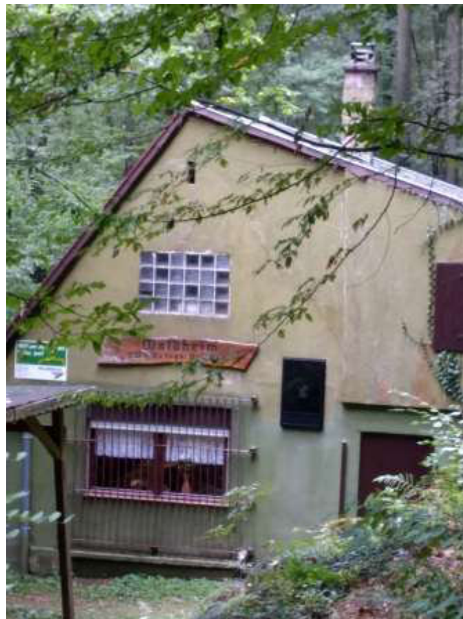
Unser Waldheim am Rappeneck